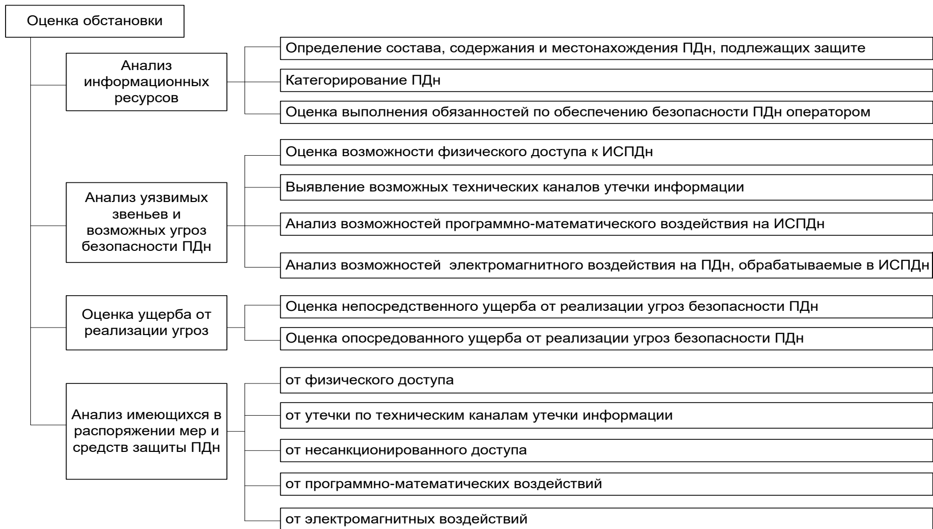
Рисунок 1. Содержание оценки обстановки